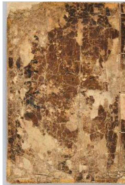
<이항복 해서 천자문>