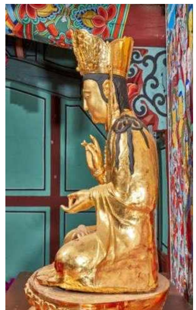
<안성 청룡사 금동관음보살좌상>