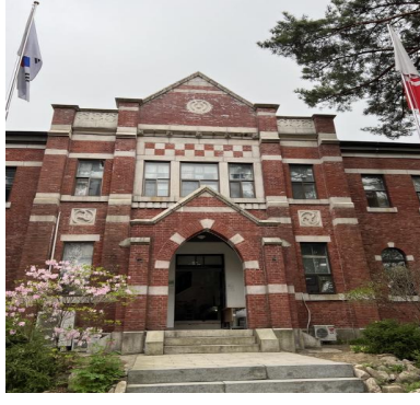
서울 천도교 중앙총부 본관(배면)