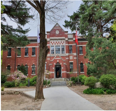
서울 천도교 중앙총부 본관(정면)