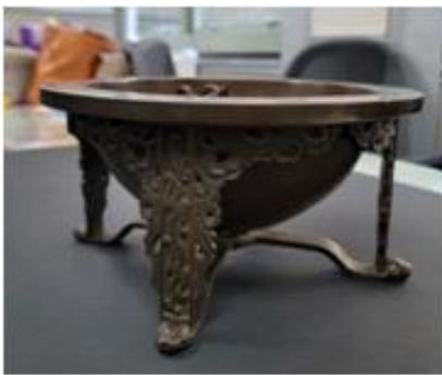
<양부일구> (성신여자대학교 박물관 소장)