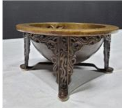
<양부일구> (국립고궁박물관 소장)