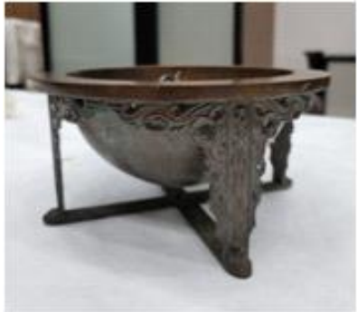
<양부일구> (국립경주박물관 소장)