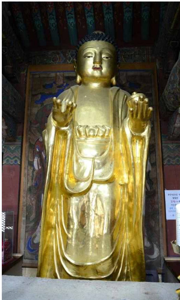
<경주 분황사 금동약사여래입상>