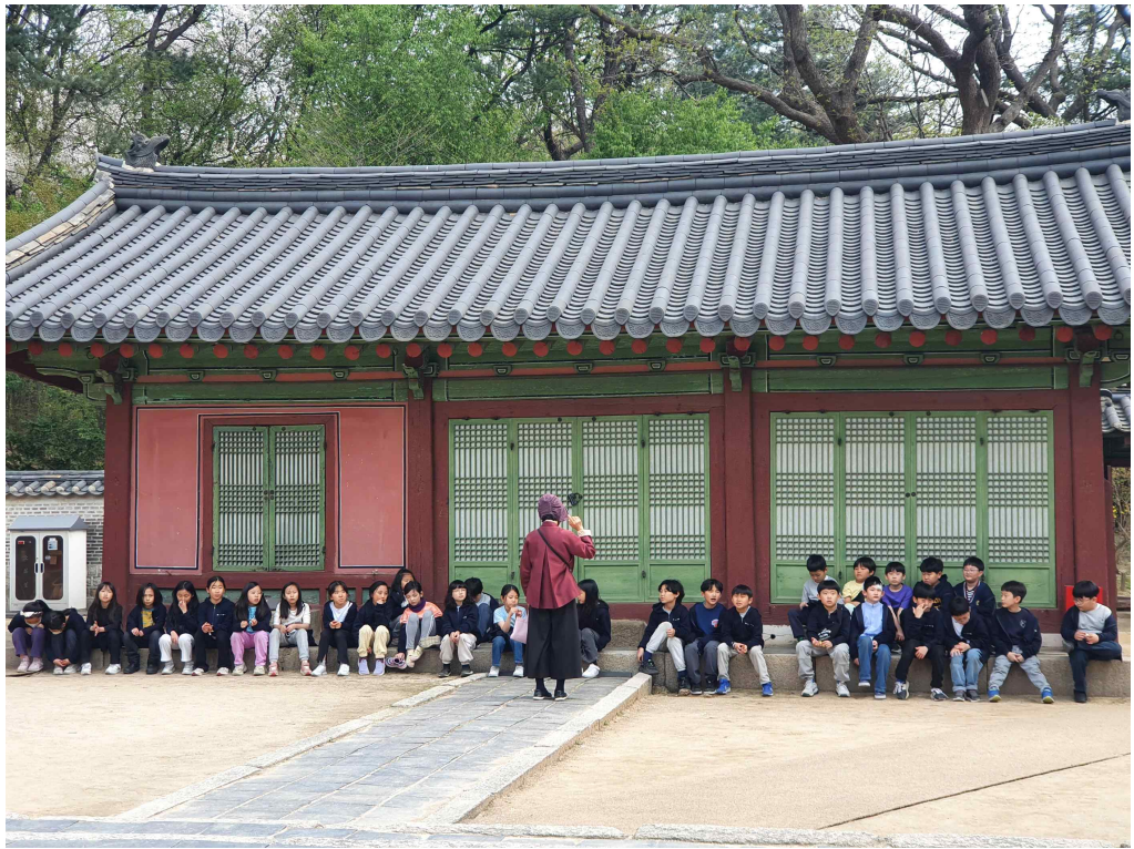
< 2024 종묘 아동 초청 식목행사('24.4.5.) >