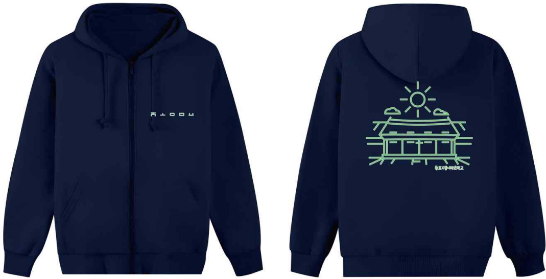
< 초청 아동 증정용 행사 단체복 >