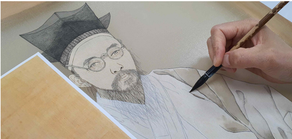
< 2024년도 상반기 전통공예체험교육(모사초상화) >