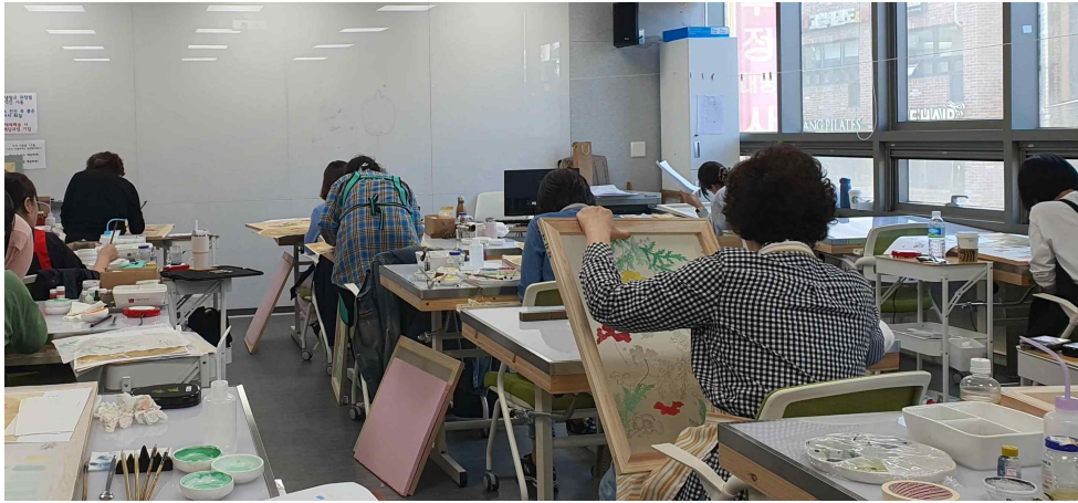
< 2024년도 상반기 전통공예체험교육 현장('24.5.16.) >