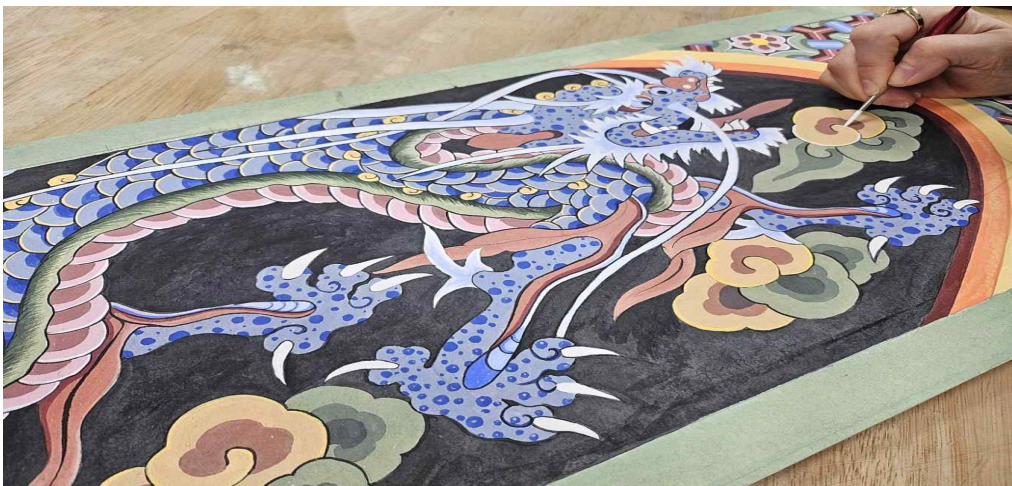
< 2024년도 상반기 전통공예체험교육(단청별화) >