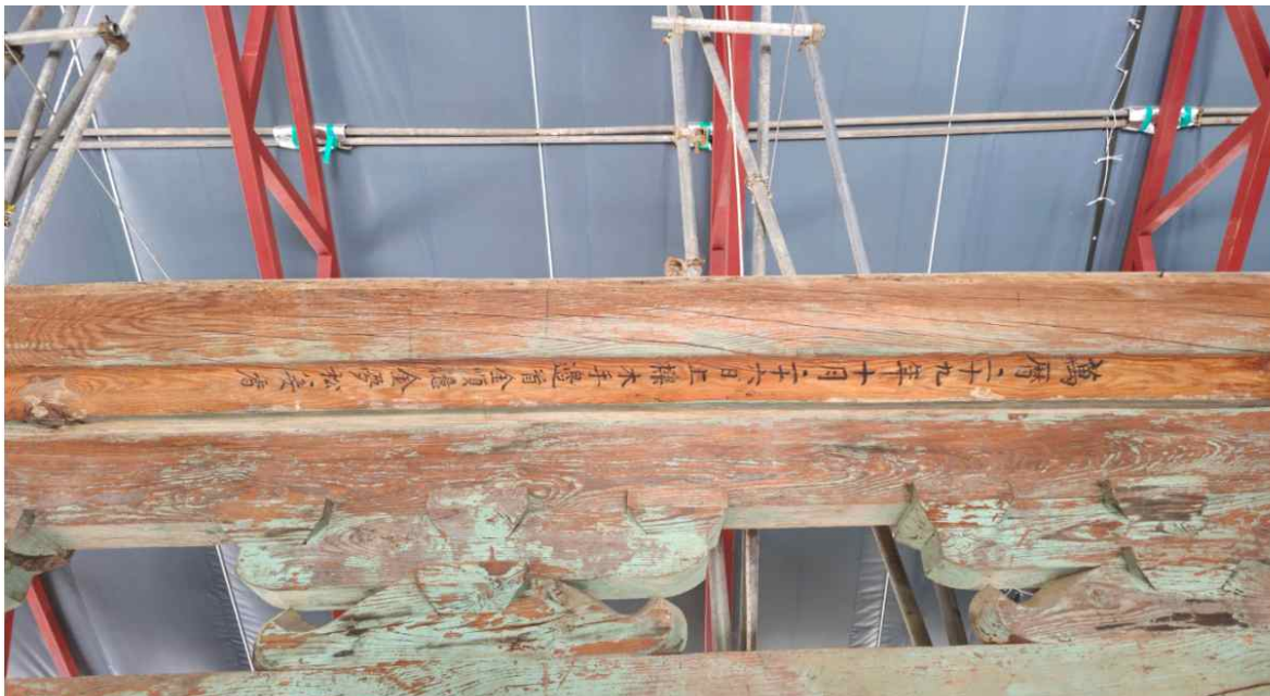
< 상량목서 상세 >