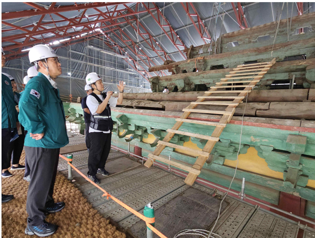
< 「서울 문묘 및 성균관」 대성전 지붕 보수 현장 방문해 종도리 하부에서 발견된 상량목서 확인하는 최응천 국가유산청장(24.7.24.) >