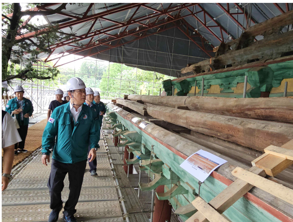
< 「서울 문묘 및 성균관」 대성전 지붕 보수 현장 방문해 해체된 지붕 구조를 살펴보는 최응천 국가유산청장(24.7.24.) >