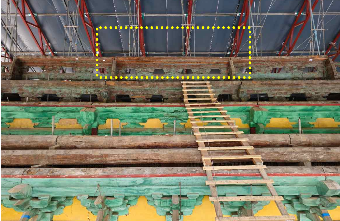
< 상량목서 발견 위치 - 중앙칸 종도리 하부 >