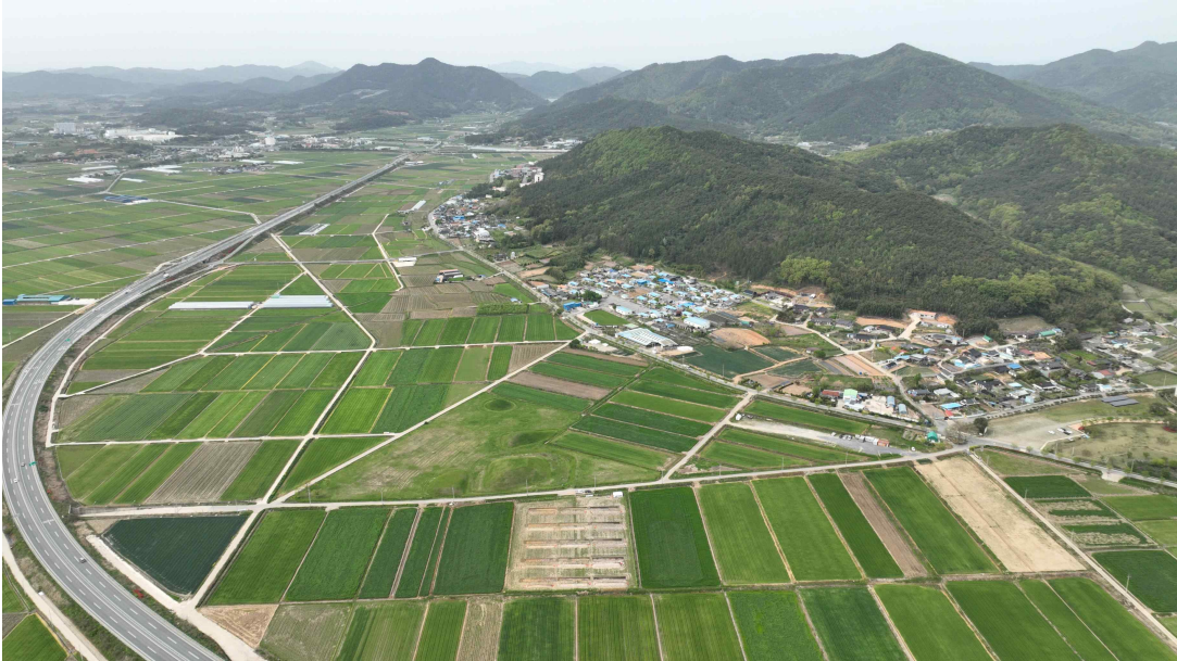
< 나주 복암리 유적 전경 >