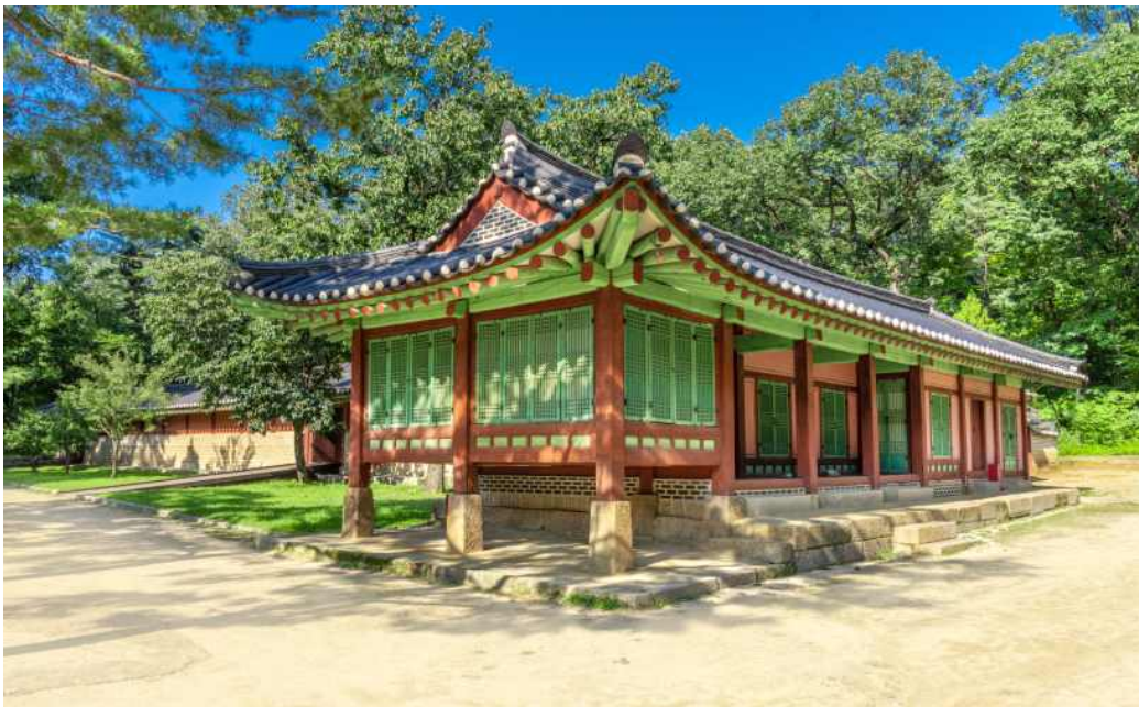
<종묘 - 망묘루 특별개방 >