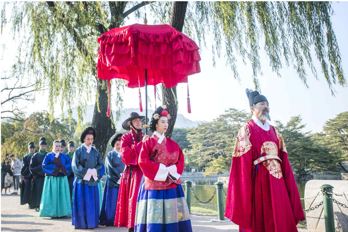
< 경복궁 - 왕가의산책 >