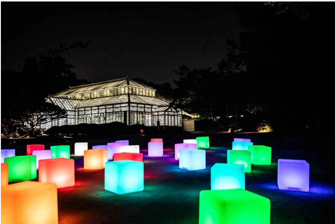
< 창경궁 - 물빛연화 >