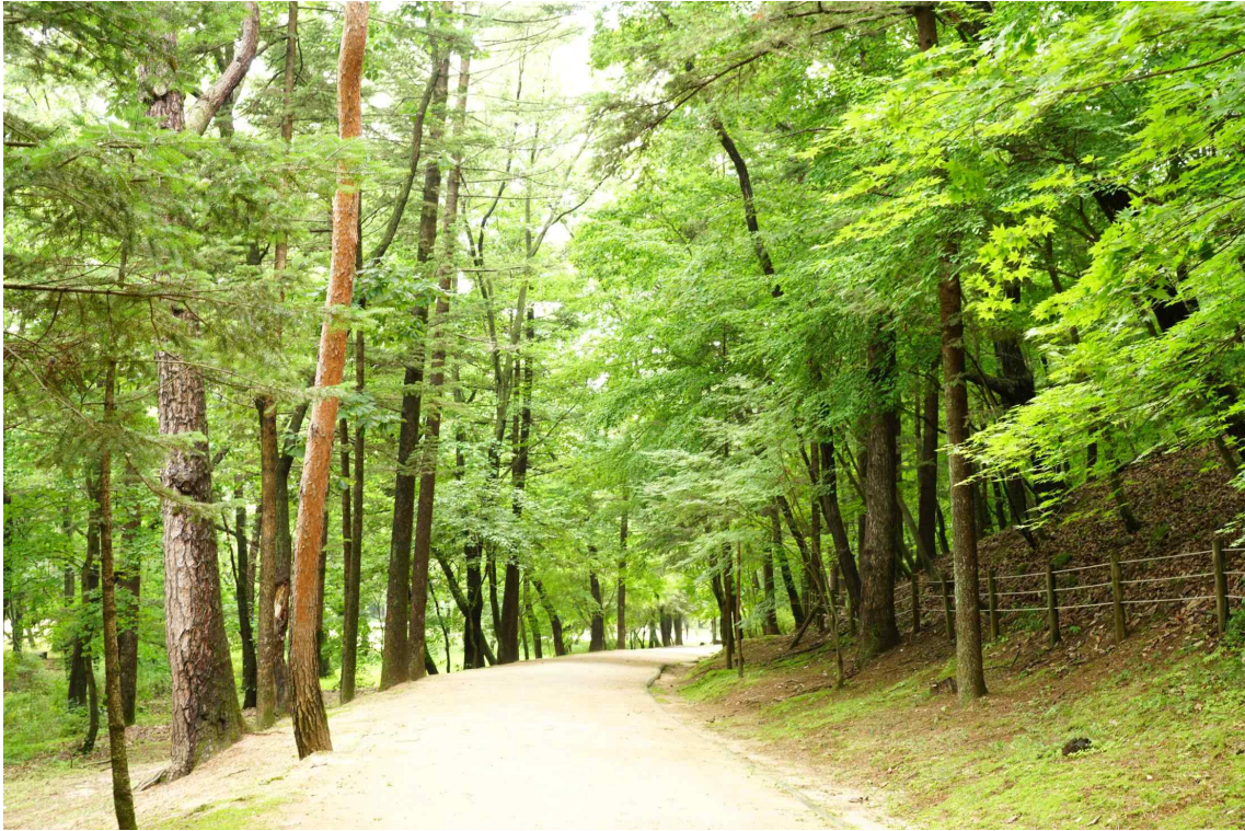
< 파주 삼릉 숲길 >