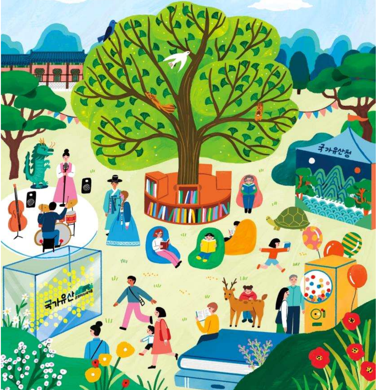
<국립고궁박물관 - 왕실도서전 포스터>

2024. 5. 17.(금) ~ 5. 27.(월) | 10:00 ~ 18:00 국립고궁박물관 은행나무 앞