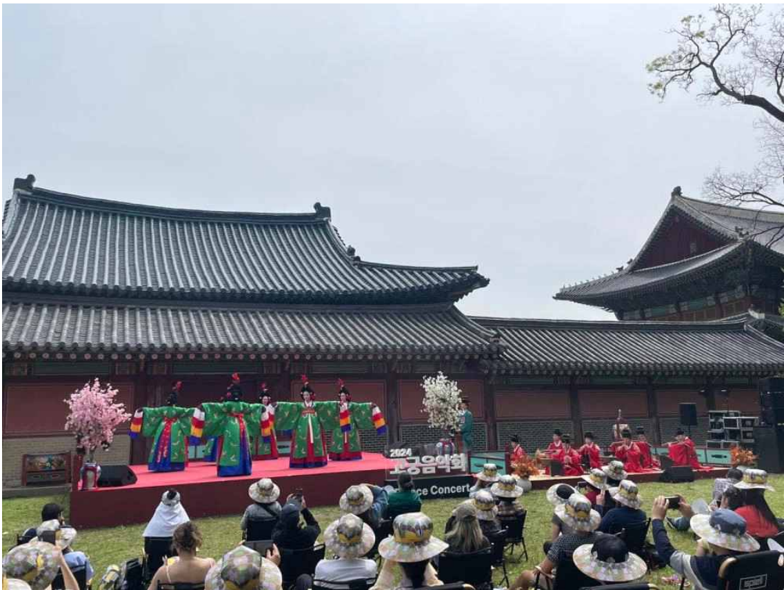
< 창덕궁 - 고궁음악회 >