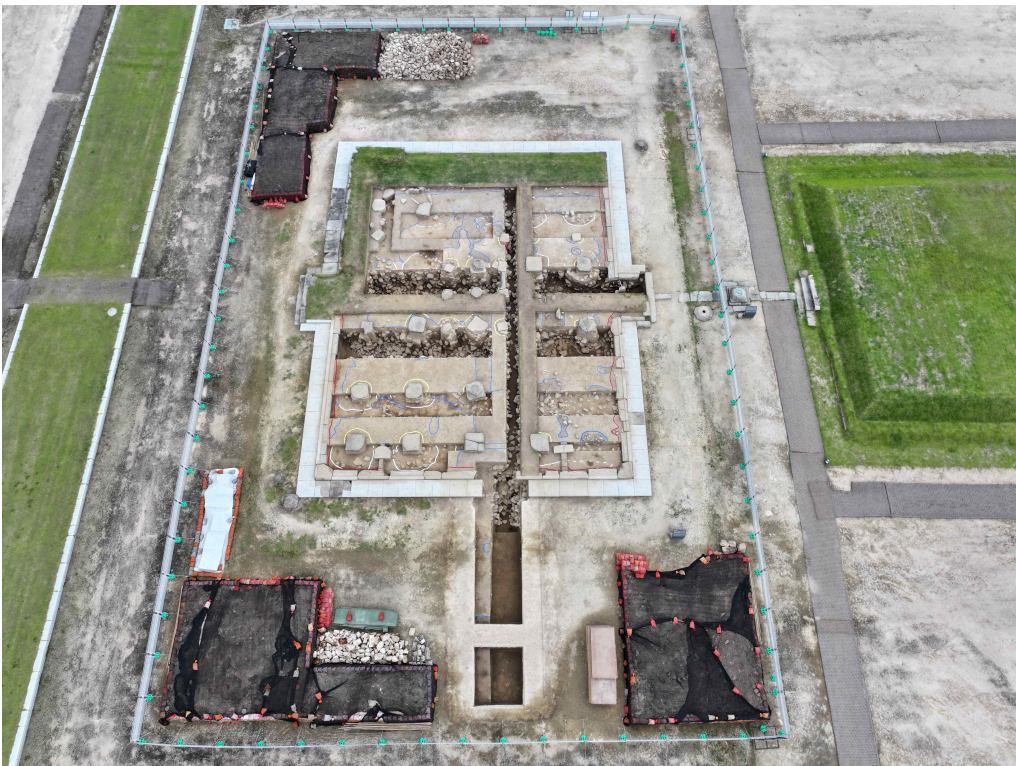
<익산 미륵사 중원 금당지 발굴조사 원경(서에서)>