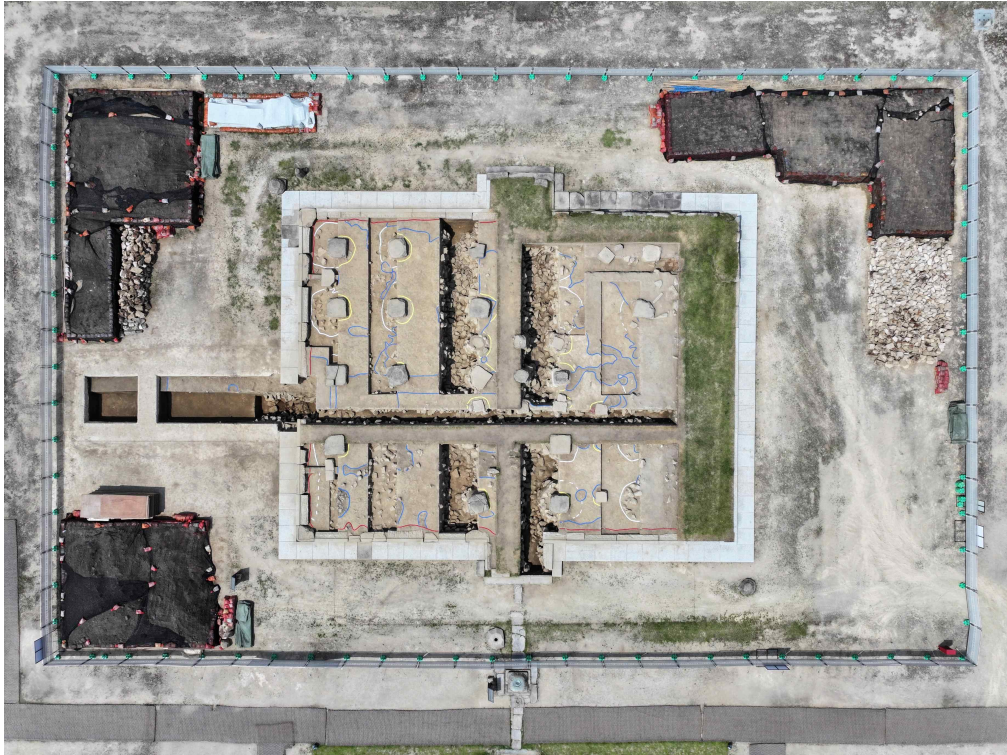
<익산 미륵사 중원 금당지 발굴조사 전경(남에서)>