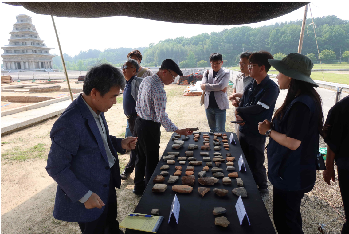
<익산 미륵사 중원 금당지 자문회의 모습(‘24.5.)>