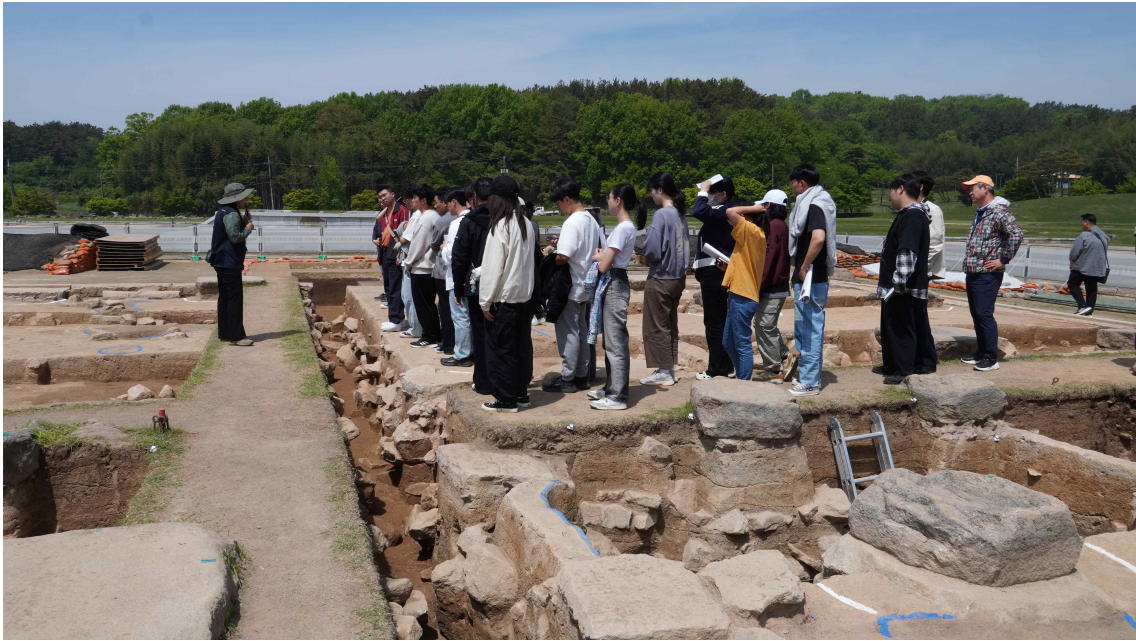
<익산 미륵사 중원 금당지 현장 답사 모습(‘24.4.)>