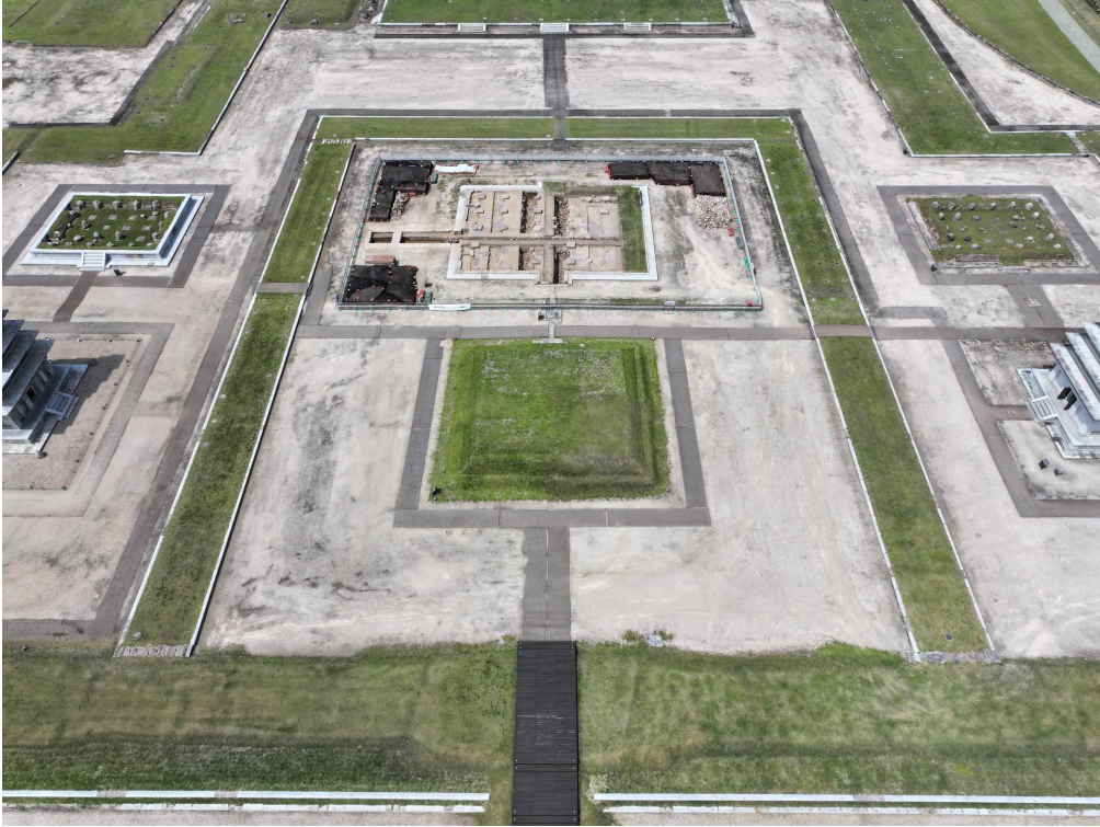
<익산 미륵사 중원 금당지 발굴조사 원경(남에서)>