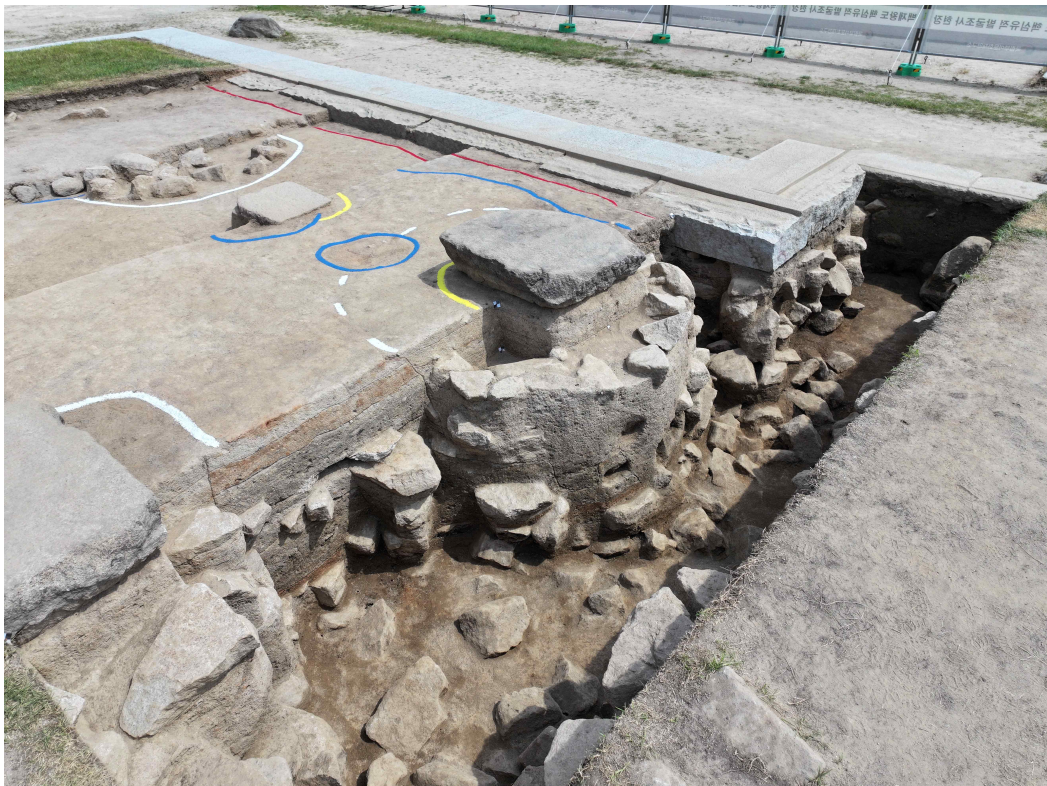
<익산 미륵사 중원 금당지 기둥 기초 구조 세부(서북에서)(2)>