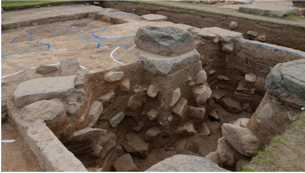
<익산 미륵사 중원 금당지 기둥 기초 구조 세부(서북에서)(1)>