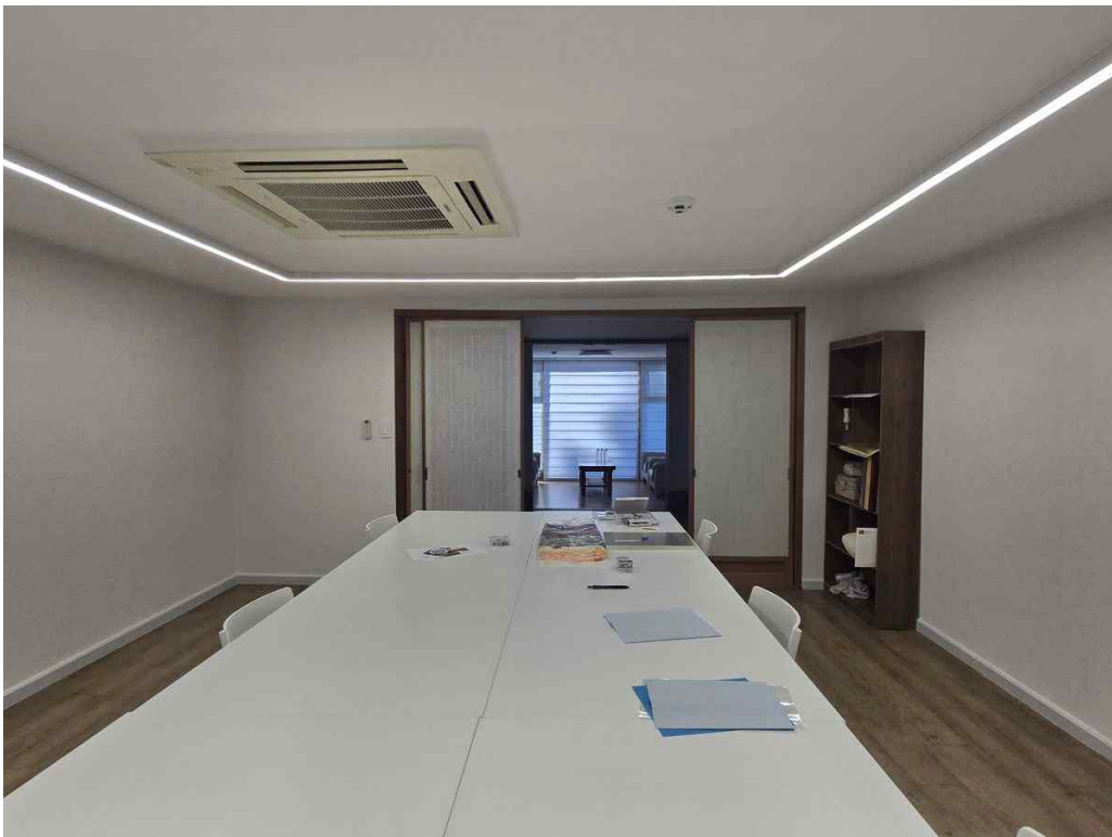
2층 실습공간 전경